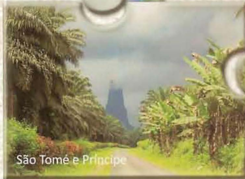
São Tomé e Príncipe